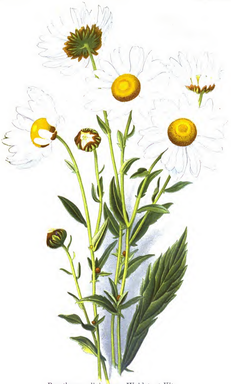
Pyrethrum uliginosum Waldst. et Kit.